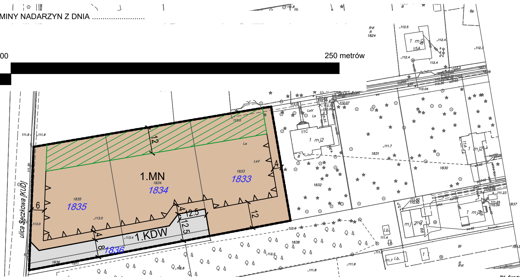
WYRYS ZE STUDIUM UWARUNKOWAŃ I KIERUNKÓW ZAGOSPODAROWANIA PRZESTRZENNEGO GMINY NADARZYN